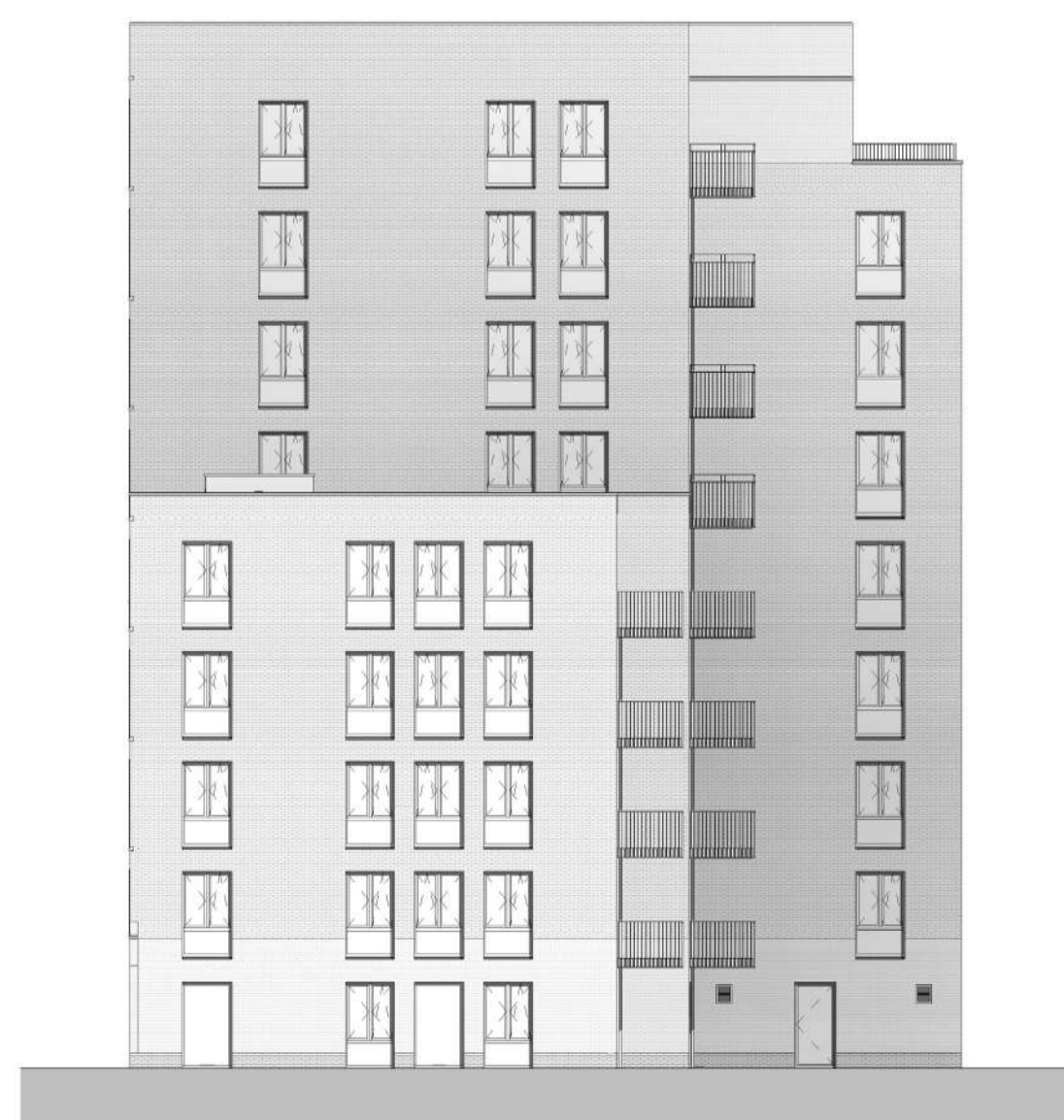
Zuidblok rechter zijgevel schaal 1 : 200