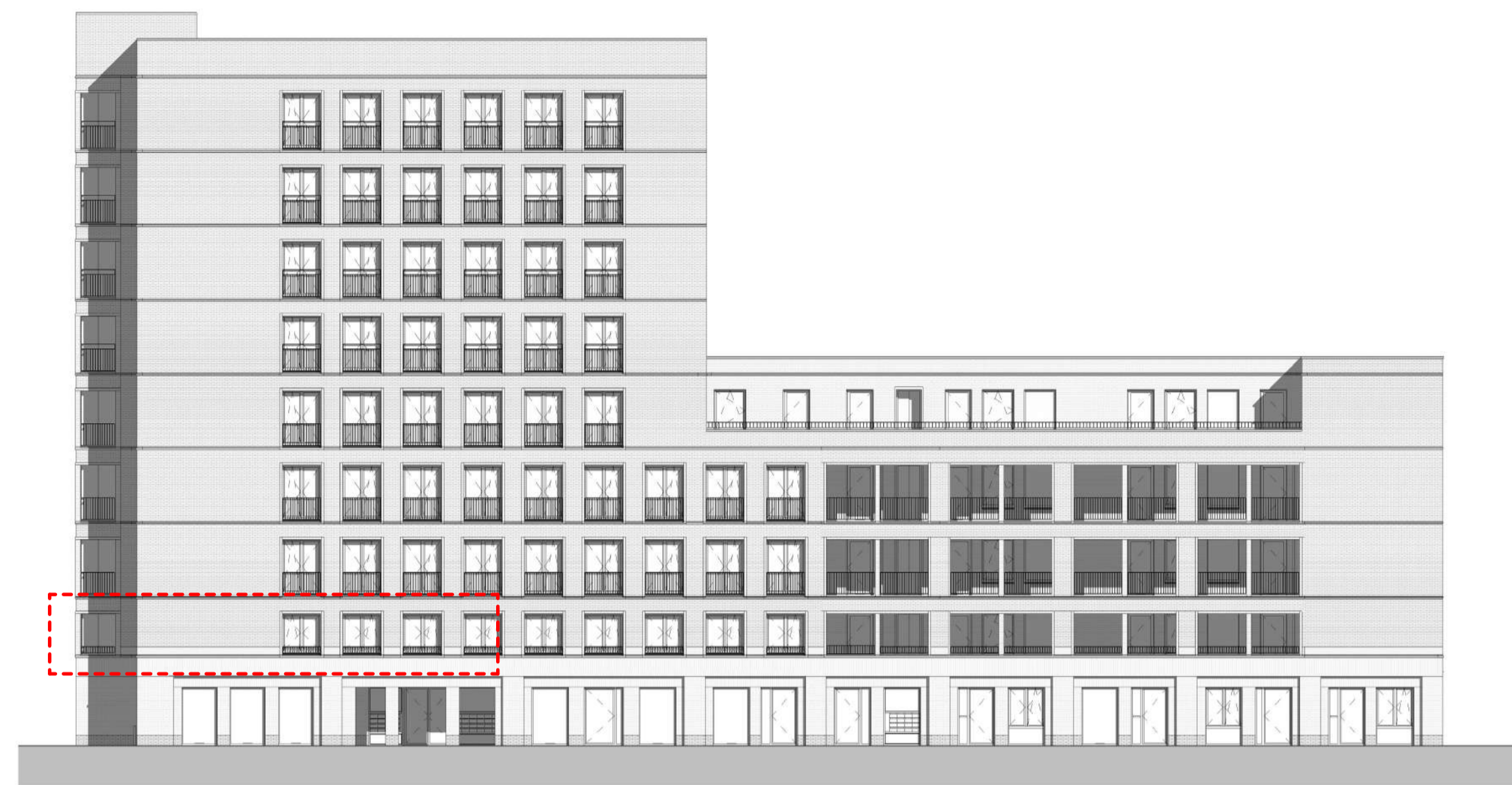
Zuidblok voorgevel schaal 1 : 200