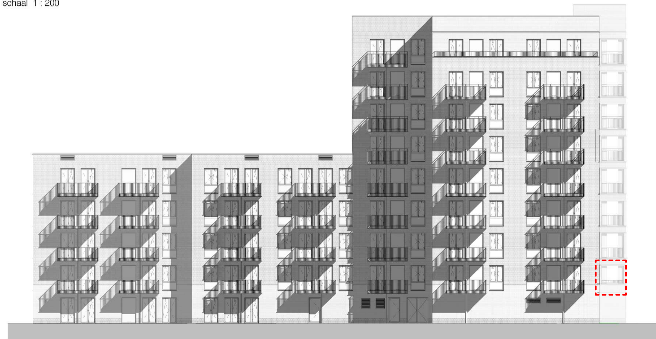
Zuidblok achtergevel schaal 1 : 200