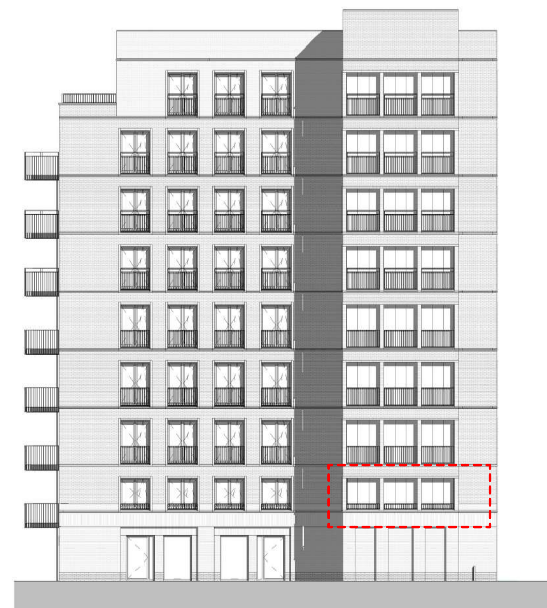
Zuidblok linker zijgevel schaal 1 : 200